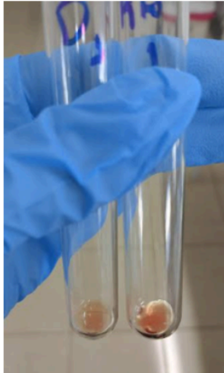
Amostra (-): DA01